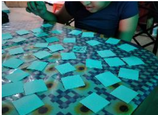
Figura 6 Actividad 4. Memoria

Nota: realización del juego de memoria que ayuda al BTAM a estimular su cerebro y concentrarse en las actividades que realice.