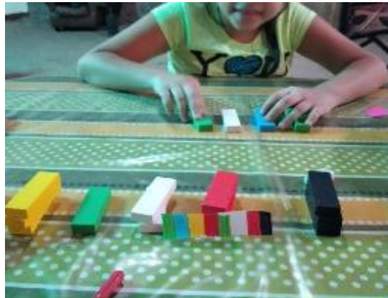
Figura 4 Actividad 2: seguimiento de instrucciones

Nota: BATM, realiza actividades de seguimiento de instrucciones para mejorar su habilidad de concentración.