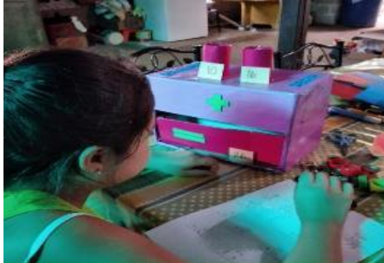
Figura 5 Actividad 3: sumas

Nota: BATM, realiza ejercitación de operaciones matemáticas sumas llevando y sin llevar.