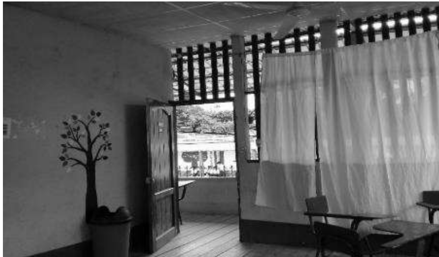
Figura No.1 Área de intervención