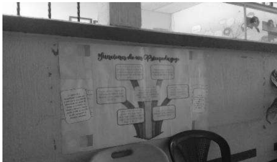
Figura No.2 Mural sobre las funciones de un psicopedagogo