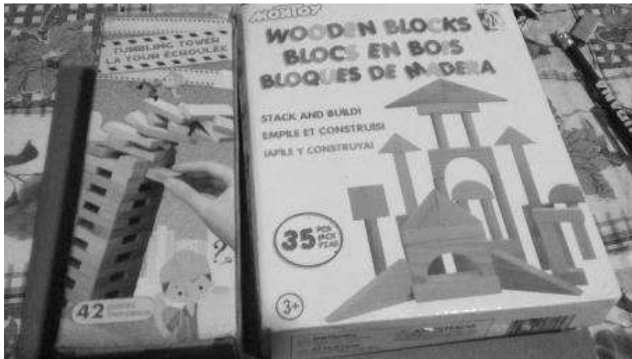
Figura No. 4 Juguetes