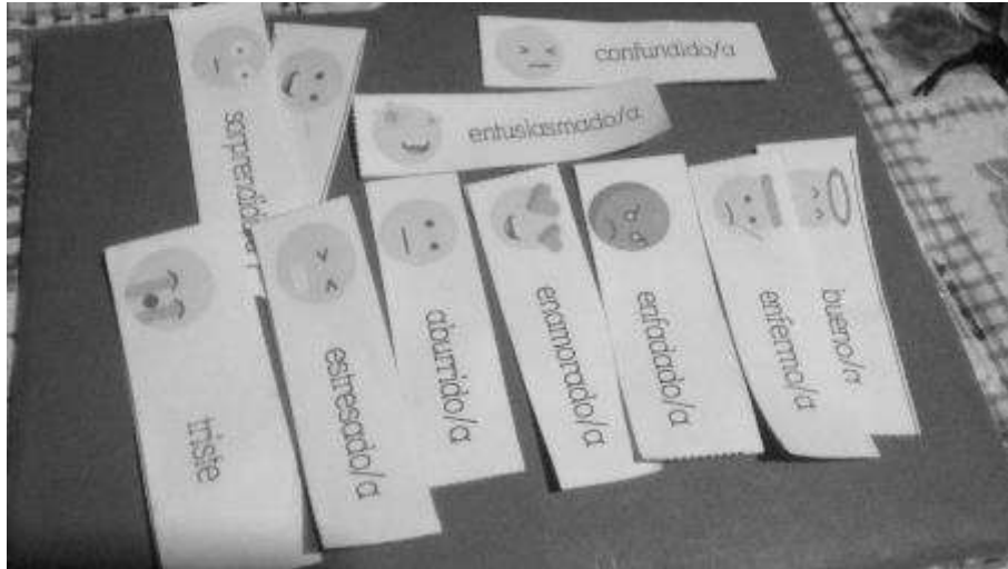
Figura No. 3 Material utilizado durante la intervención