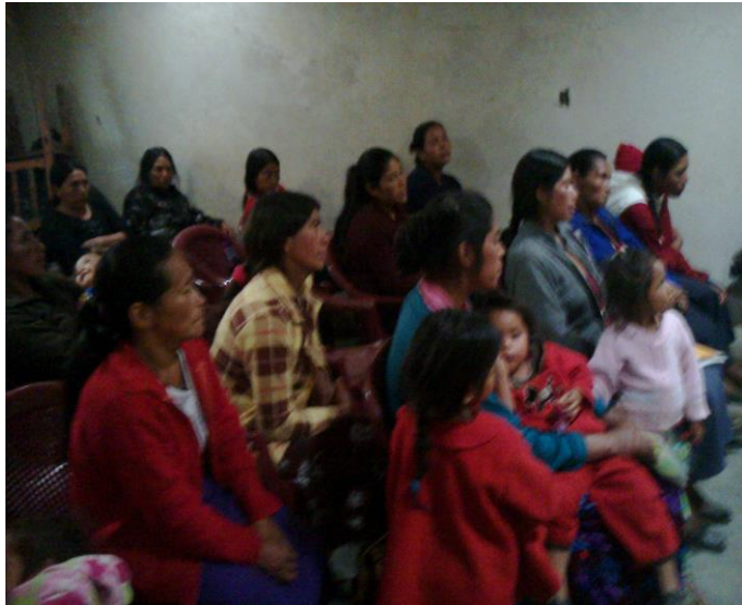
Fotografía grupo Eterna Primavera, Aldea San José Caben, capacitándose sobre las funciones que desempeña una junta directiva

Cabe destacar que las capacitaciones de fortalecimiento a las juntas directivas sirvieron para dejar bien cimentado sobre las funciones que cada una de las señoras juega dentro de cada grupo y ellas dijeron estar complacidas por esta aclaración que se les hizo y expresaron que iban a esforzarse por practicar los conocimientos que se les brindó.