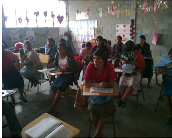
Fotografía grupo Espiga de Oro, Aldea Corral Grande recibiendo capacitación sobre autoestima.

En las capacitaciones de autoestima las señoras se mostraron muy complacidas por el desarrollo de esta capacitación y expresaron que han ido perdiendo espacios debido a que los varones no las dejan hablar y ellas tampoco exigen esa participación, pero que de ahora en adelante iban a tomar el valor de participar.