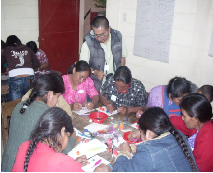
Fotografía elaboración de bisutería, grupo de mujeres Espiga de Oro, Aldea Corral Grande.

actividades se realizaron respetando el sentir de cada socia integrante por grupo y con ello se cumple lo que de una u otra forma habían solicitado.