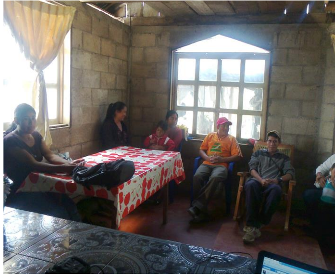
Fotografía capacitación a Juntas Directivas, grupo ADECOMUJER Aldea San Andrés Chapil