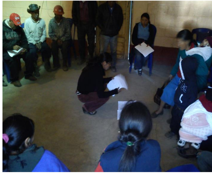
Fotografía grupo ADECOMUJER de Aldea San Andrés Chapil con su pareja conyugal recibiendo capacitación de género

En las capacitaciones de género se les indicó que podían invitar a sus parejas al desarrollo de las mismas y un grupo de señoras fueron las únicas que si realizaron esta invitación, con lo cual manifestaron que ellas se creían débiles para realizar tareas que según sabían solo los hombres podían hacerlo, porque así se les había indicado de pequeñas, pero se les hizo la aclaración de que en algunos trabajos donde se requería fuerza física mayor si, pero que también podían involucrarse en apoyar, de lo contrario eran capaces de desenvolverse en todo sentido y a todo nivel.