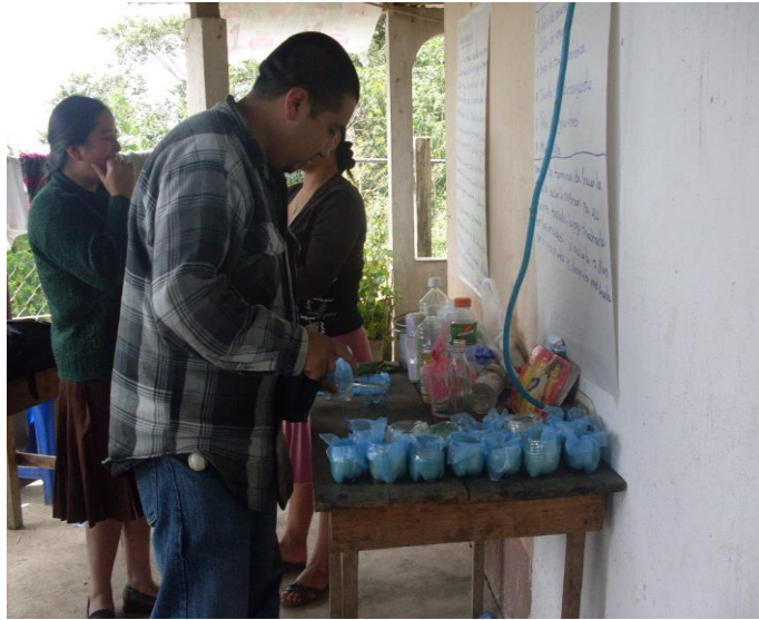
Fotografía grupo Revolución del Siglo XXI, Aldea Provincia Chiquita, realizando práctica de elaboración de jabón artesanal.

Como ya se había ganado confianza en las señoras después de haberse ejecutado las capacitaciones anteriores fueron muy participativas en el desarrollo de la otra temática o de los otros temas y como siempre manifestaban su agradecimiento en cada una de ellas.