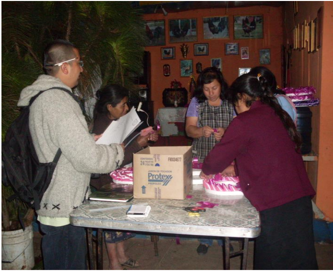
Fotografía elaboración de manualidades grupo ADECCOMUJER, Aldea San Andrés Chapil