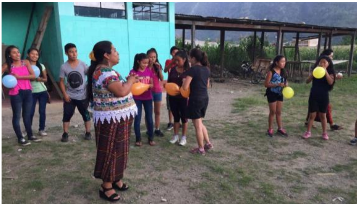
Foto 5. Dinámica de diagnóstico de la práctica de valores.