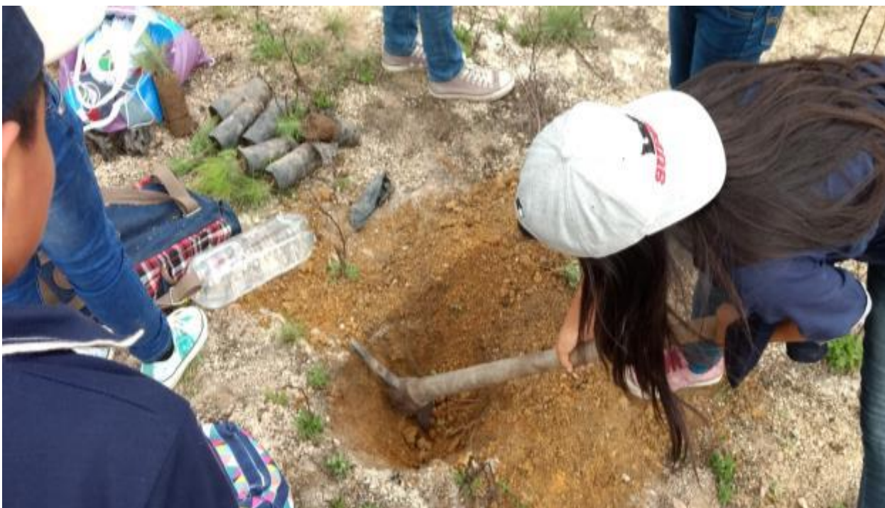
Foto 4. Estudiantes del IMAYA en una actividad co-curricular.