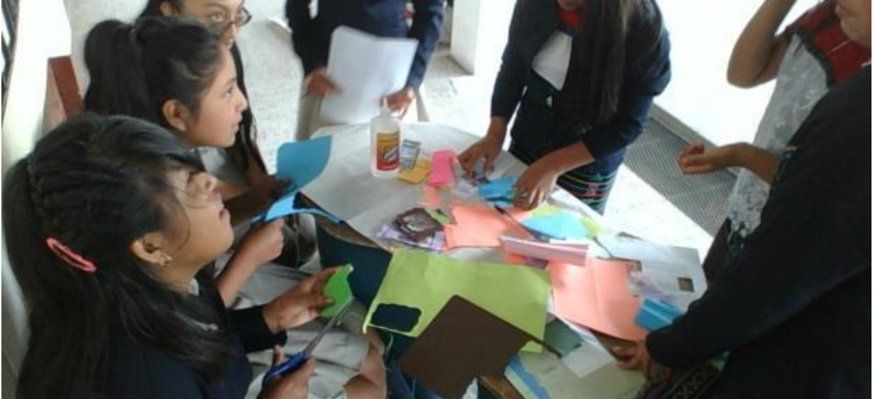
Foto 1. Estudiantes elaborando materiales didácticos para una exposición grupal.

Fotografías de la Práctica Docente en el Instituto Mayance Aguacateco