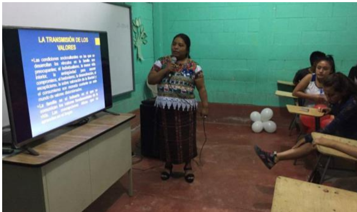
Foto 6. Desarrollo del tema a estudiantes del IEBICH.