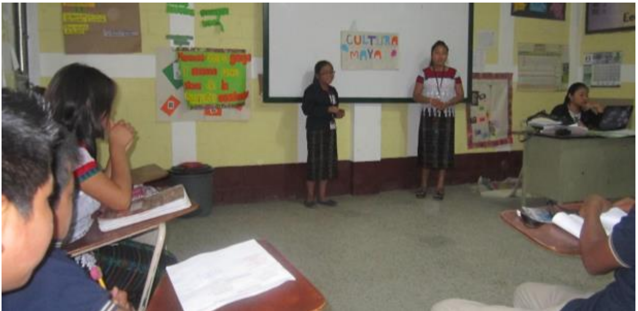
Foto 2. Estudiantes exponiendo un tema en clase.