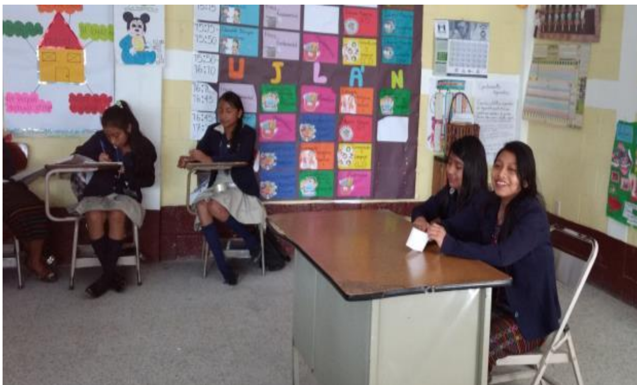
Foto 3. Estudiantes de Segundo Básico “B” presentando un tema de manera creativa.