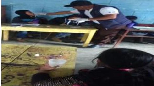
Fuente. Escuela en el municipio de Cotzal