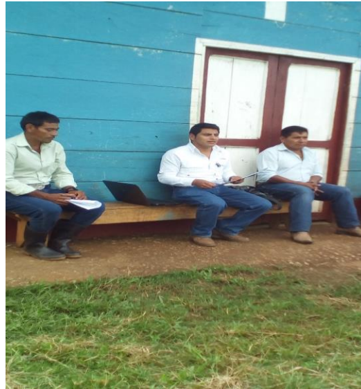
Foto del trabajo en la Comunidad