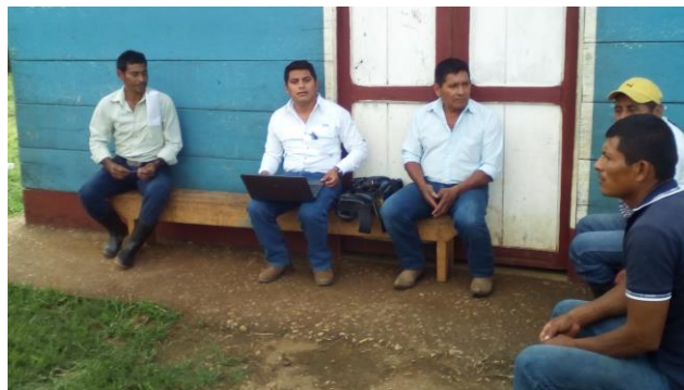
Foto del trabajo en la Comunidad