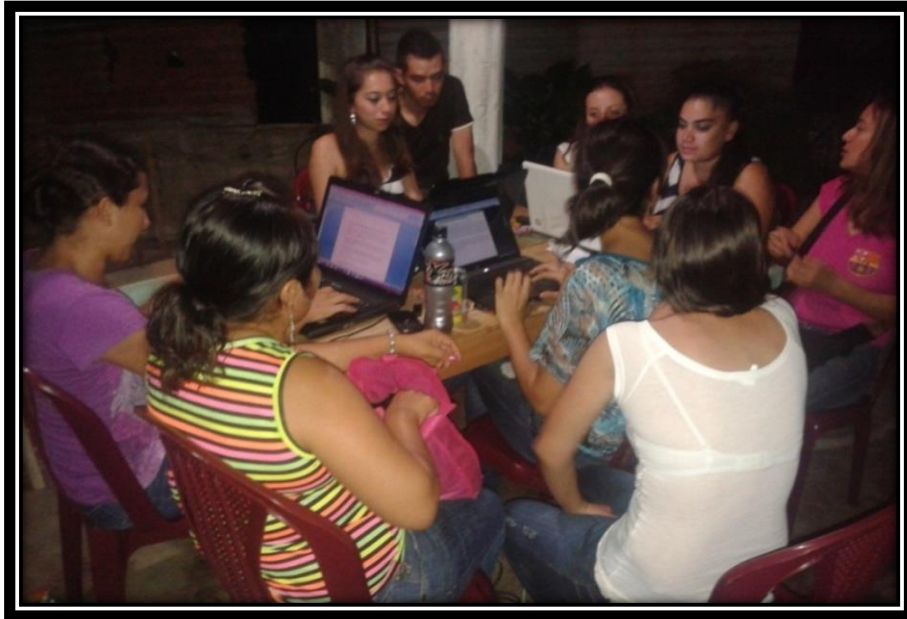
Sesiones de trabajo para la realizar el informe de Seminario de la Sistematizacion de Practica Docente