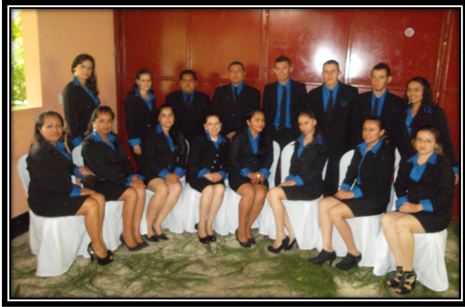
Grupo No. 1 seminaristas Sede Santa Cruz el Chol