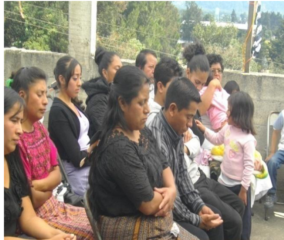
Fotografía de alumnos, dando charlas de valores. Padres de familia recibiendo. El tema: de la deserción