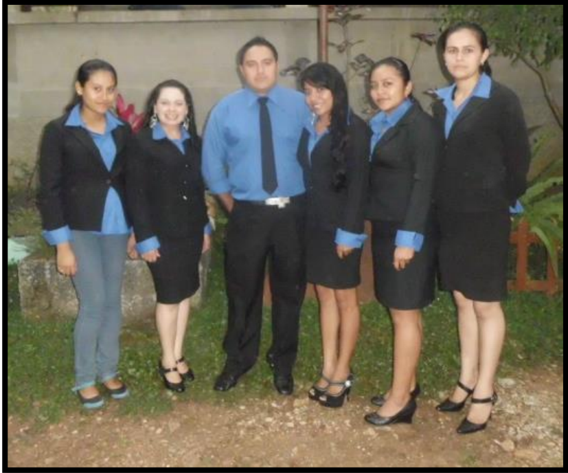
Docentes practicantes Instituto Nacional de Educación Básica (INEB) Los Lochuyes, Santa Cruz El Chol, Baja Verapaz.