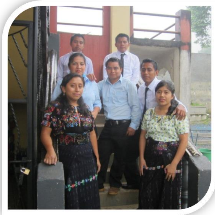
Fotografía promoción de la cohorte 2011