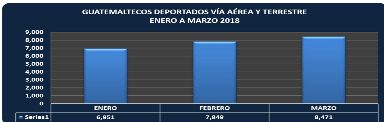
Gráfico No. 2