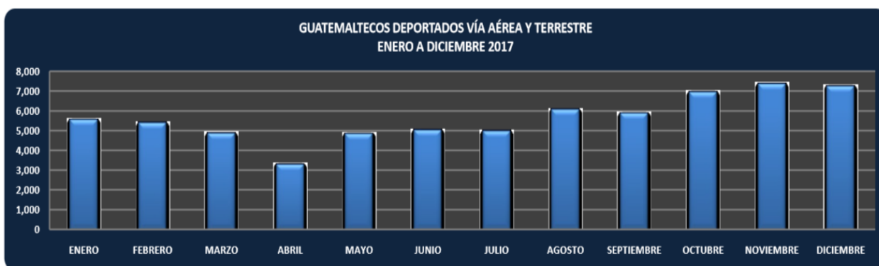
Gráfico No. 1