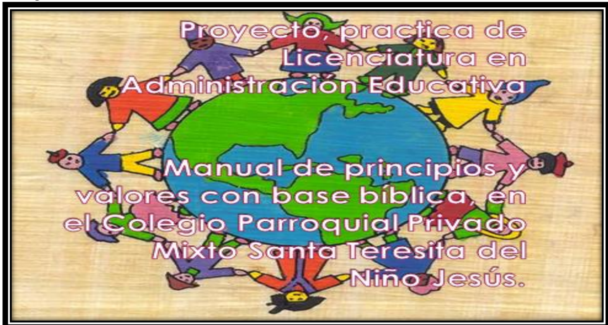
Portada del Manual