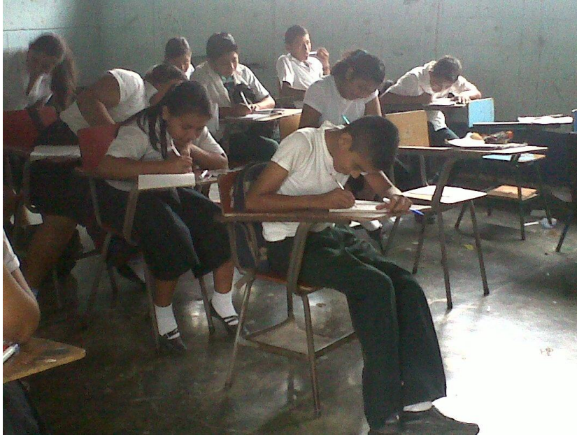
Estudiantes realizando tareas relacionadas con temas impartidos.