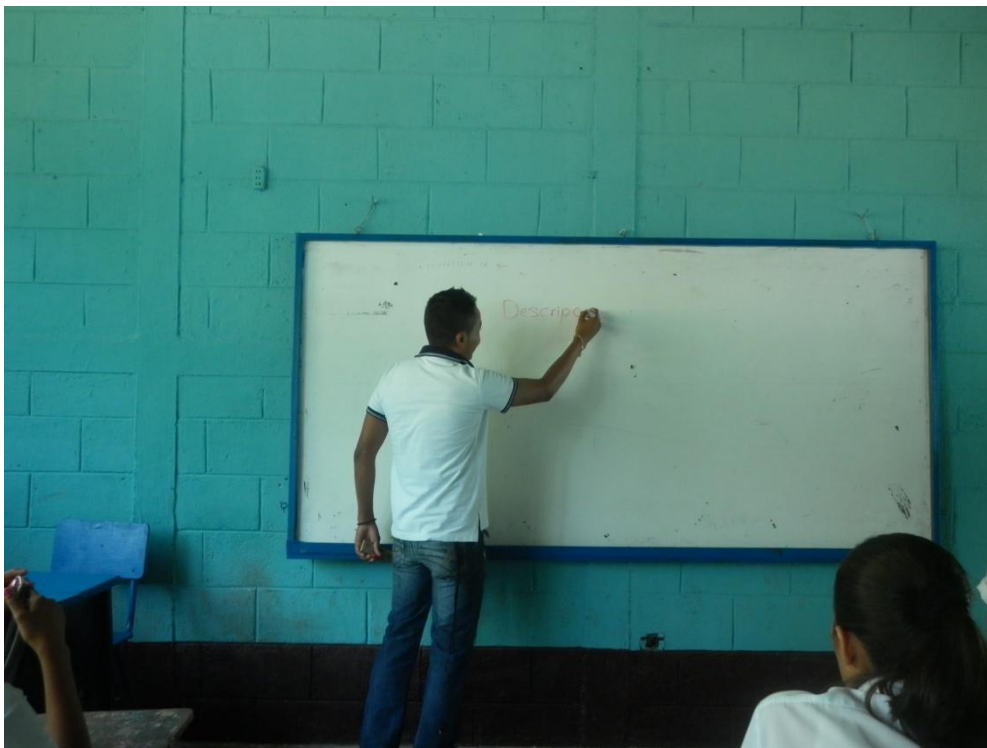
Estudiante practicante explicando ejercicios a todo los alumnos.