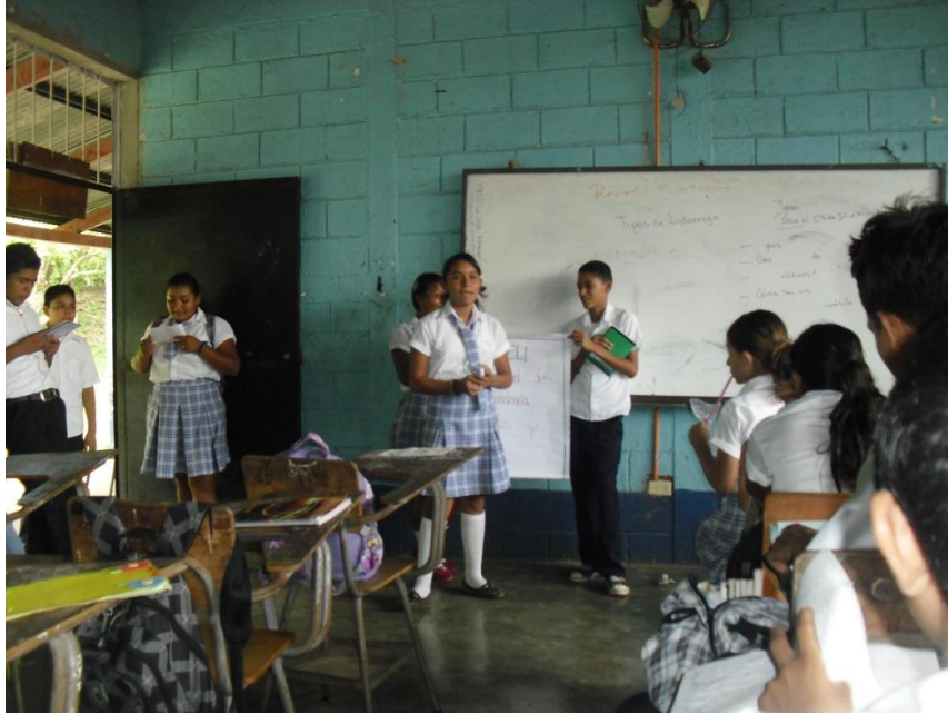
Estudiantes presentando trabajos de exposición grupal.