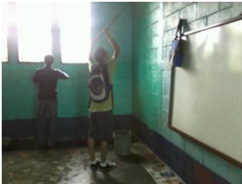
Se realizó la actividad de pintar el aula con todo el grupo de estudiantes, los gastos fueron cubiertos por el alumno practicante.