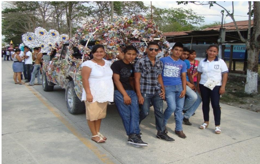
Apoyo en actividades realizadas por el establecimiento, acompañada por maestra de planta y alumnos.