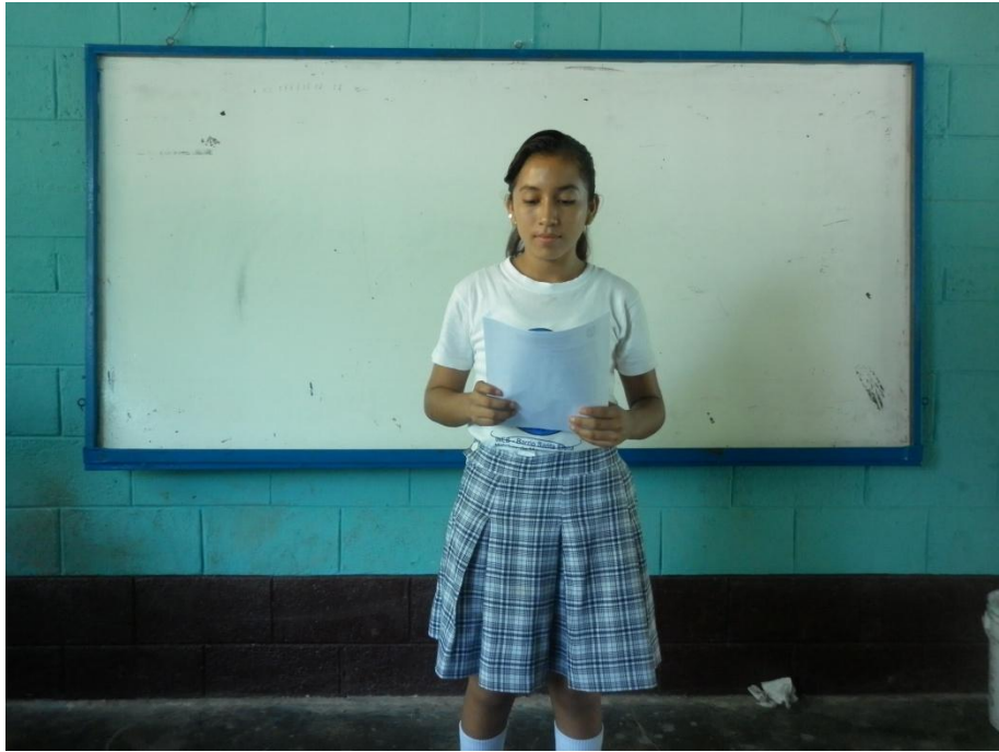
Estudiante participando en actividades de grado.