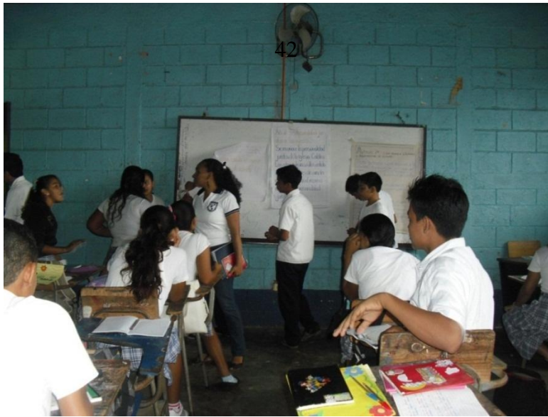
Alumno practicante brindando ayuda a los estudiantes en exposiciones grupales.