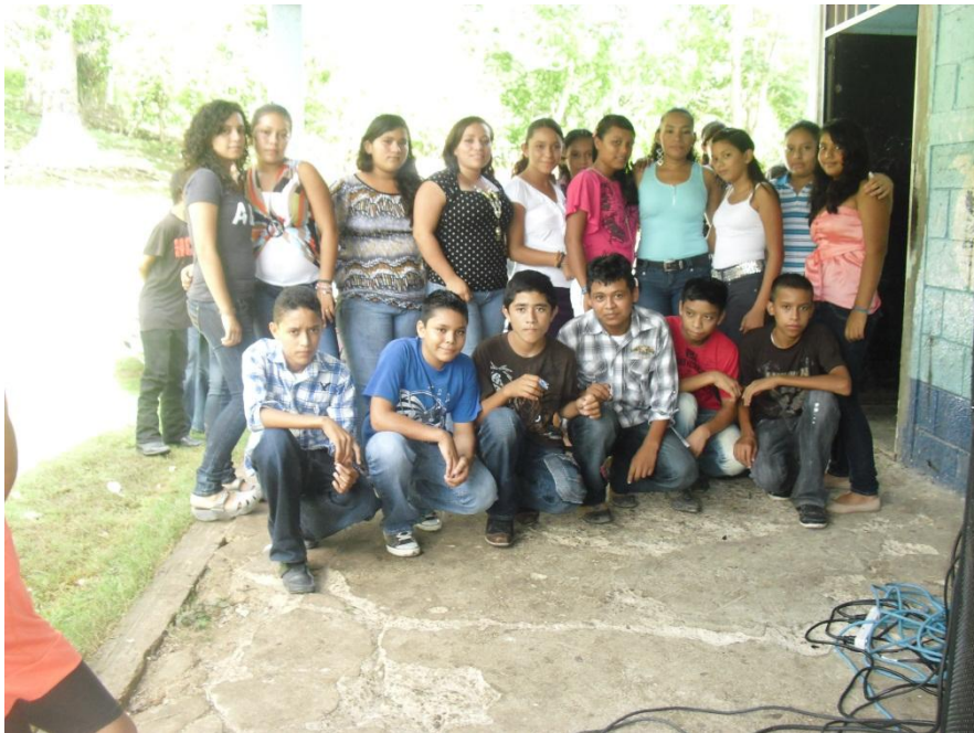
Dentro de las actividades realizadas durante el transcurso de la práctica docente también se hizo la despedida del alumno practicante.