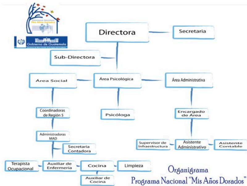
Imagen No. 2 Estructura organizativa de la Institución SOSEP