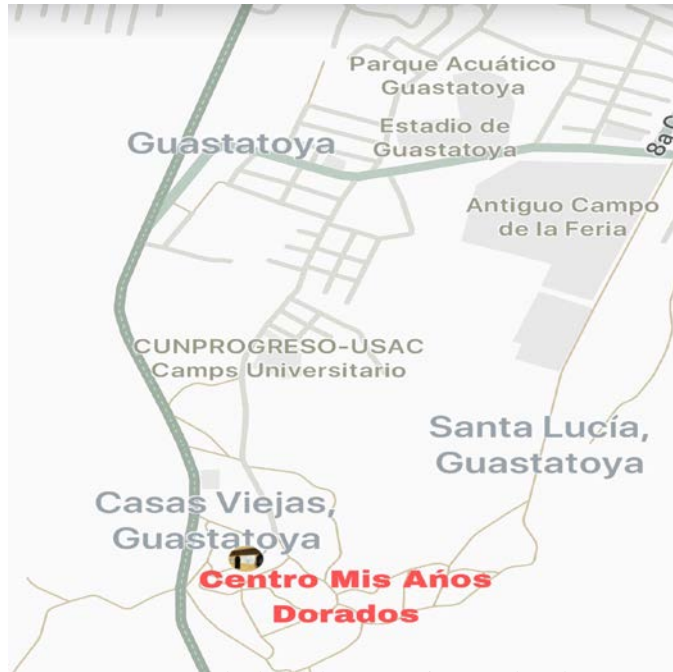
Imagen No. 1 Mapa de ubicación de Guastatoya El progreso