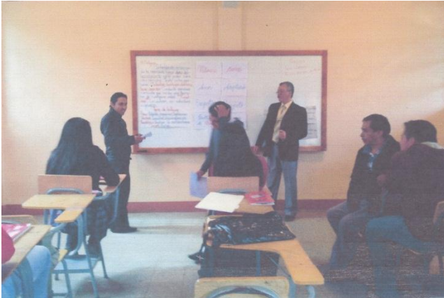
Imagen de actividad institucional sobre el “Reciclaje”, en ENBI- MAM, San Juan Ostuncalco.

Imagen de actividad Institucional sobre el “El Bullying” Instituto Municipal Br. Werner Gadiel Morales Hernández Palestina de los Altos.