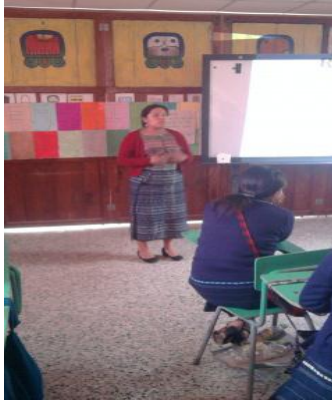
Imagen de actividad institucional sobre el “Reciclaje”, en ENBI-MAM, San Juan Ostuncalco.