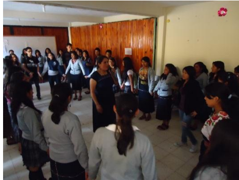
Imagen de actividad institucional sobre “El valor de la igualdad”, en el Instituto Privado Mixto Sibilia. (INPRIMISI)

Imagen de actividad Institucional sobre “Factores que inciden en la Educación” en el Colegio Mixto La Sabiduría, San Juan Ostuncalco.