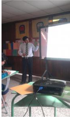
Imagen de actividad Institucional sobre “Factores que inciden en la Educación” en el Colegio Mixto La Sabiduría, San Juan Ostuncalco.

Imagen de actividad institucional sobre el “Reciclaje”, en ENBI-MAM, San Juan Ostuncalco.