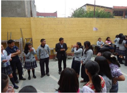
Imagen de actividad Co-curricular el Colegio Mixto La Sabiduría, San Juan Ostuncalco.

Imagen de actividad Institucional sobre “Factores que inciden en la Educación” en el Colegio Mixto La Sabiduría, San Juan Ostuncalco.