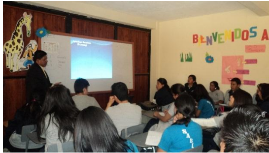
Imagen de actividad Institucional sobre “Factores que inciden en la Educación” en el Colegio Mixto La Sabiduría, San Juan Ostuncalco.

Imagen de actividad Co-curricular sobre “Aprendizaje Electrónico”, Colegio Mixto La Sabiduría”, Ostuncalco.