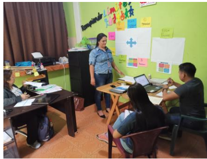
Figura 5 Aplicación de la técnica del FODA