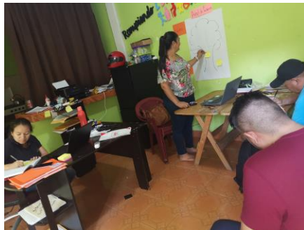
Figura 6 Aplicación de la técnica de árbol de problemas