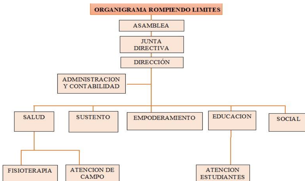
Figura 1 Organigrama Asociación Rompiendo Límites ASORO