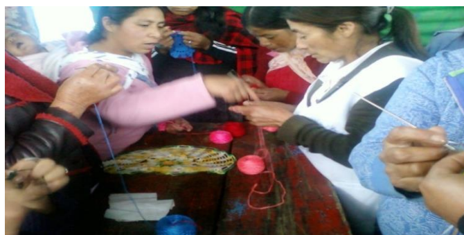
Ilustración 4 Elaboración de tapetes como proceso de fortalecimiento de grupo de mujeres

d) Manualidades: en términos generales, son trabajos efectuados con las manos, con o sin ayuda de herramientas. También se denomina así a los trabajos manuales realizados como actividades de fortalecimiento de grupos en oficina municipal de la mujer.