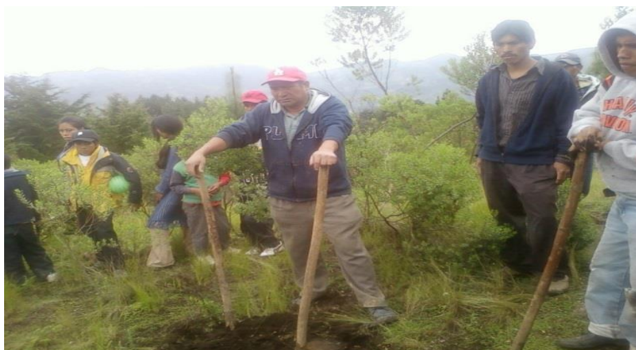
Ilustración 3 Preparación del suelo para reforestación

c) Reforestación: tenemos el conocimiento que la reforestación es establecer vegetación arbórea en terrenos con aptitud forestal. Consiste en plantar árboles donde ya no existen o quedan pocos; así como su cuidado para que se desarrollen adecuadamente en las distintas comunidades que reciben apoyo de la oficina municipal de la mujer, niñez y adolescencia en el municipio de Tacaná.