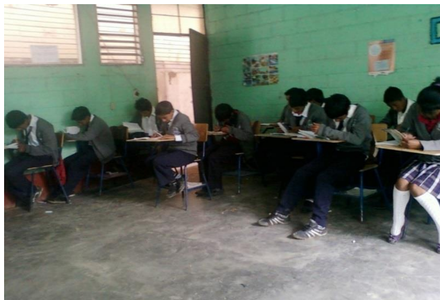
Ilustración 2 Capacitación sobre la importancia de la organización juvenil

Capacitaciones: es una actividad sistemática, planificada y permanente cuyo propósito general es preparar, desarrollar e integrar a los recursos humanos al proceso productivo, mediante la entrega de conocimientos, desarrollo de habilidades y actitudes necesarias para el mejor desempeño de todos los grupos que aglutina la OMMNA.