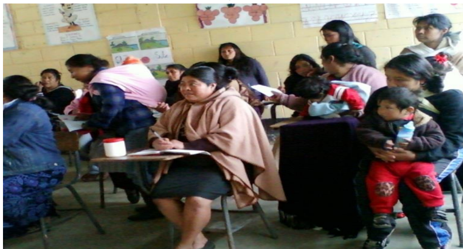
Ilustración 1 Asamblea para organización y elección de Junta directiva de grupo de mujeres